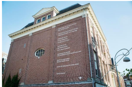
Tekst op het gebouw van de Bezige Bij