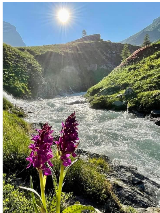
Uit: Opwekking 459, Andy Park / Mireille Schaart

Daar bij de rivier gaan je voeten dansen. Daar bij de rivier Zingt je hart een lied Daar bij de rivier Gaan je ogen lachen; Kom drink het water, Ontvang het om niet.