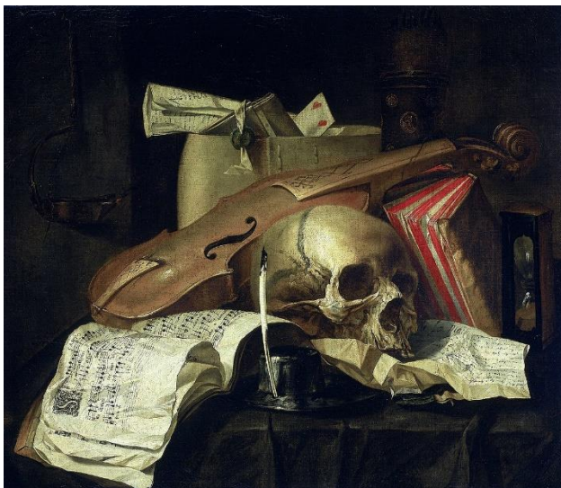
'Vanitas stilleven' door N.L. Peschier. 'Vanitas' is Latijn voor 'ijdelheid'.

Prediker benadrukt de betrekkelijkheid van al ons aardse geploeter en onze aardse zorgen. Het is voor hem allemaal 'ijdel', in het Hebreeuws 'hebel', dat ook betekent: lucht, vluchtig, iets wat geen houvast biedt. We gebruiken dat woord 'ijdel' soms nog voor iemand die erg met zijn/haar uiterlijk bezig is: een meisje dat vaak voor de spiegel staat en overdreven aandacht besteed aan haar make-up.